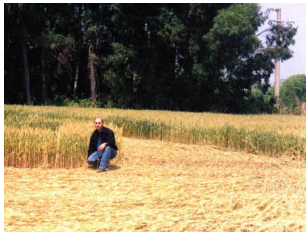
Foto - Sacripanti all'interno del crop di Sabaudia e un particolare del cerchio.

Dopo un vano giro su internet, alla ricerca di qualche notizia più dettagliata sul crop segnalato a in provincia di Latina, gli inquirenti del Centro Ufologico Nazionale del Lazio si organizzano per fare un sopralluogo alla volta di Sabaudia.